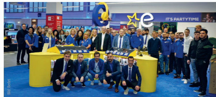
Team Berlet Durch regelmäßige Schulungen in der hauseigenen Akademie werden die Mitarbeitenden der insgesamt acht Filialen stets auf dem neuesten Stand der Technik und Beratungskompetenz gehalten