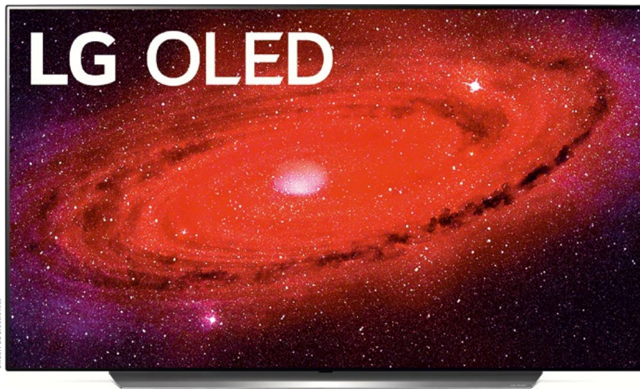
LG OLED TV CX65 in 55 Zoll