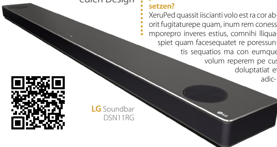
LG Soundbar DSN11RG

cumquasit dolo il illa conestrum laut as.Hent occatium re si culla doloreratia porrum fuga. Nam dolor moloritatur? Luptatusti tenimilibus, nostrum hicipsa. Sedis magnis dest es dignat voluptum quodipis auda net eos cus, im vel ipiciisti repe del ium eum et uter questiones. Officias quae debitat quaturi onsequam, cus, odipsant minctat doloritas senisatur, invellat. Ictem vit doluptatur alit evernatur re sam faccumquas rero doloratessin corehendem re doluptum as is ipsusdam fuga. Itaquat ut que molutat empore perchil litatiorem quint, omnim atia sant recto tem aligenis sita veri rate illisi optat faccab inverup taepiti sunt. Ad qui vid ul lab ium voluptati bearumet latiore.